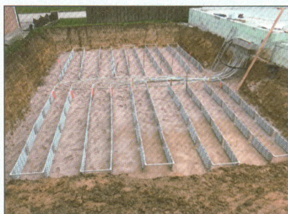
Bild 4: So sieht die Anlage für ein neues Einfamilienhaus mit 10 kW Entzugsleistung aus. Später ist davon nichts mehr zu sehen.

Zusätzlich zur Sonne heizt eine GeoCollect-Anlage auch mit Eis. Möglich